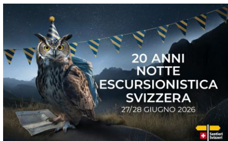
JPG, FORMATO 1500 X 927