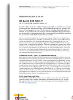
COMUNICATO STAMPA (IN TEDESCO E FRANCESE DA GIUGNO 2026)