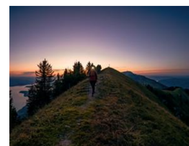
1 IMMAGINE EVOCATIVA