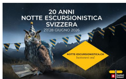
JPG, FORMATO 1500 X 927 CON ELEMENTO DI RICHIAMO