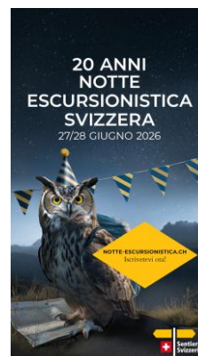
JPG, FORMATO 1080 X 1920 CON ELEMENTO DI RICHIAMO