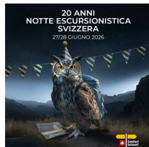
JPG, FORMATO 1080 X 1080