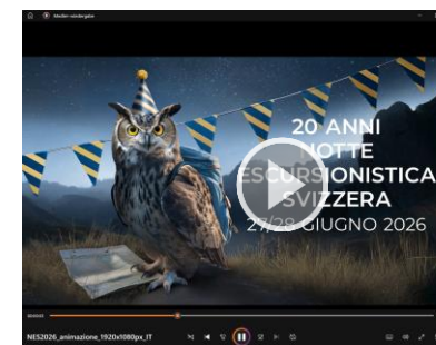
VIDEO MP4 (ANIMAZIONE) FORMATO 16:9