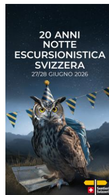
JPG, FORMATO 1080 X 1920