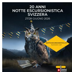
JPG, FORMATO 1080 X 1080 CON ELEMENTO DI RICHIAMO