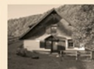
103 Montlinger Kienberg