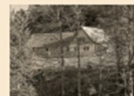
108 Kriessner Schwamm