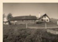
101 Oberrieter Kienberg