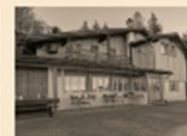
109 Montlinger Schwamm

Herzlichen Dank: Ortsgemeinde Oberriet · Rhode Kienberg Holzrhode Ortsgemeinde Montlingen · Ortsgemeinde Holzrhode · Ortsgemeinde Kriessern Ortsgemeinde Eichenwies · Ortsgemeinde Diepoldsau www.oberriet.ch/ortsgemeinden