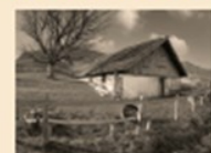
102 Holzholder Kienberg