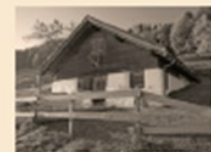
105 Holzholder Strüssler