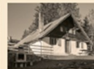
106 Eichenwieser Schwamm