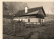
104 Oberrieter Strüssler