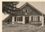
107 Diepoldsauer Schwamm